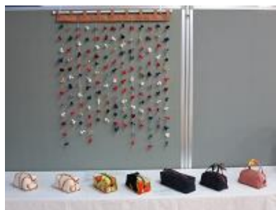
「インテリアのれん、小物入れ、100本のバラ」