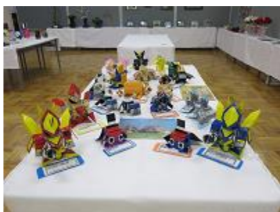
「たくみのスタモンの仲間たち」 長野養護学校高等部2学年