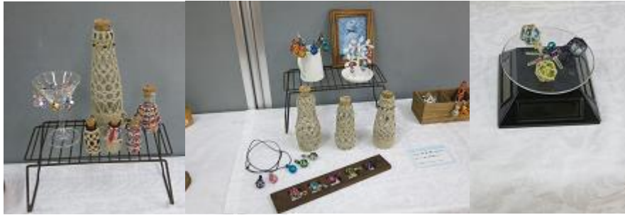
「漁師の浮き球風アクセサリ」