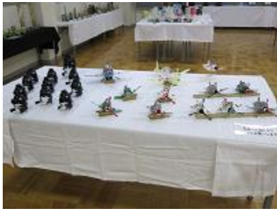
「各種戦闘機、ペンギン」