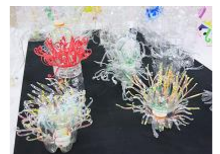
「ペットボトルの森、めぐる」