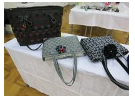
「トートバッグ、ポストンバッグ、ルームシューズ、セーター、マフラー」